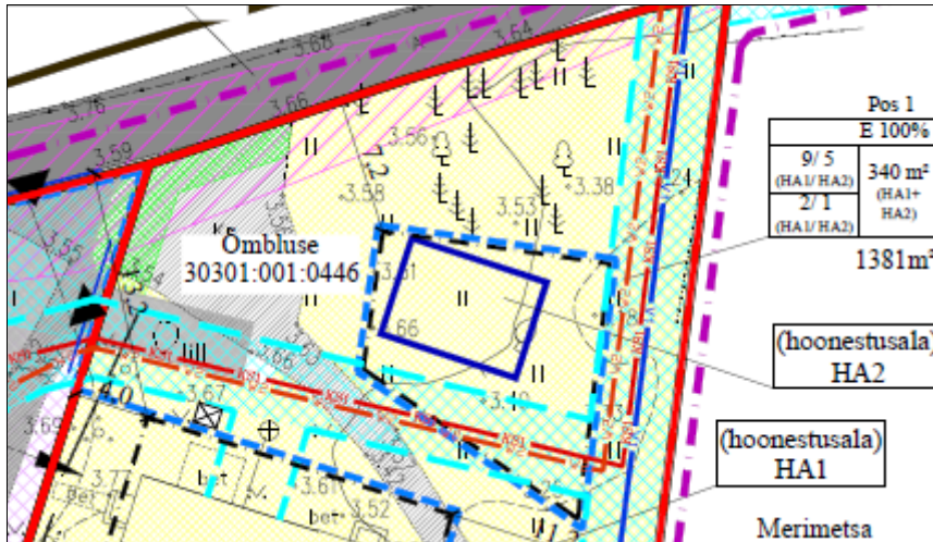
Joonis 1. TRAM-s kooskõlastatud põhijoonis